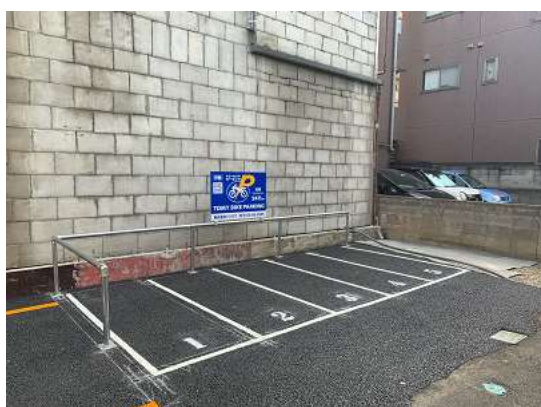
*バイクパーキング 浅草

※詳細については、株式会社トミザワ (0120-86-8585 / 9:00-17:00 日祝除く) にお問合せください。