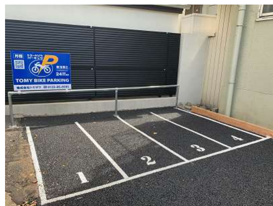
*バイクパーキング東浅草 2