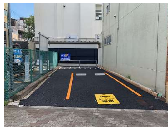
*バイクパーキング東浅草 2